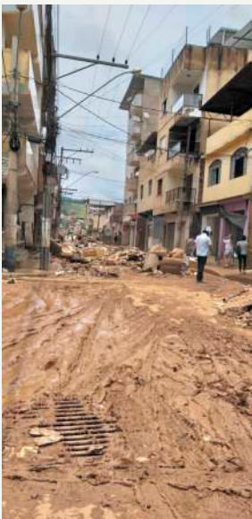
Ruas do Centro