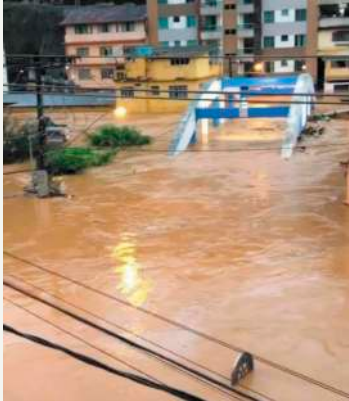
Ponte dos Arcos

Atenção: Cremos que essa enchente é mais um alerta para que cuidemos melhor do meio ambiente, não construamos em lugares de risco (próximo ao rio e encostas) e que cuidemos melhor do Rio Manhuaçu.