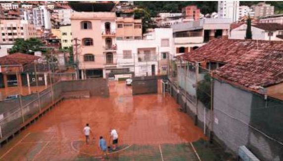
Estacionamento IPM - Início limpeza