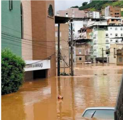
3º IPM / Ponte estreita