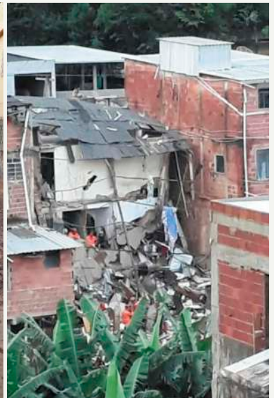
B. Engenho da Serra